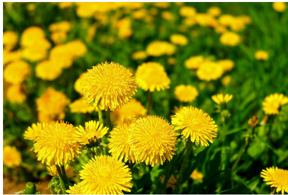
Tarassaco/dente di leone

L'arrivo della primavera è il momento ideale per cominciare il tuo inventario!